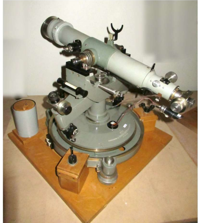
Präzisions-Theodolit mit wälzbarem Fernrohr, Beleuchtungseinrichtung und Reiterlibelle im Holzkasten, Gerätenummer 113436, Askania-Werke AG, Bambergwerk Berlin-Friedenau, aus dem Jahr ca. 1940

Weitere Nachrichten und mehr Details sowie aktuelle Informationen sind zu finden unter