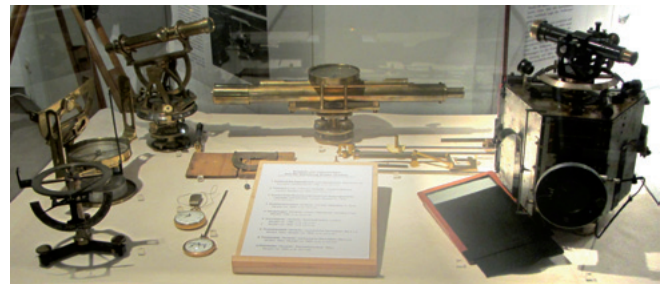
Bildeindruck aus der MKK-Ausstellung u. a. mit Inklinatorium, Deklinatorium, Nivelliere, Bussole, Hängebogen, Phototheodolit