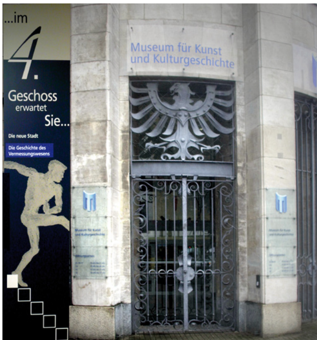
Links im Bild: Ein Wegweiser zur Vermessungsgeschichte im Dortmunder Museum für Kunst und Kulturgeschichte

Der Förderkreis veranstaltet alle drei Jahre Symposien zur Vermessungsgeschichte. Beim kommenden Symposium Anfang 2017 wird Friedrich Robert Helmert im Mittelpunkt stehen. Schließlich verleiht der Förderkreis regelmäßig den mit 2.500 EUR dotierten Eratosthenes-Preis für herausragende Arbeiten zur Vermessungsgeschichte. Die halbjährigen „Nachrichten“ berichten über Wissenswertes aus der Vermessungsgeschichte, ebenso die Homepage www.vermessungsgeschichte.de , insbesondere im Bereich Aktuelles.