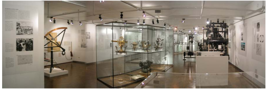
Blick in die Dauerausstellung